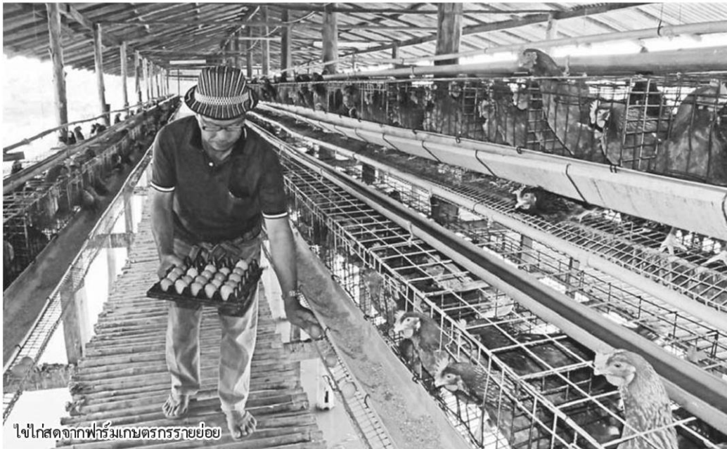
ไข่ไก่สดจากฟาร์มเกษตรกรรายย่อย

ราคาไข่ไก่ตกต่ำเป็นปัญหาของใคร...? เป็นคำถามที่ไม่ต้องการคำตอบ หน่วยงานที่รับผิดชอบกลับปล่อยให้ปัญหารื้อรังมาอย่างยาวนาน ถึงวันนี้ยังไม่รู้ว่ามีจุดจบอยู่ที่ใด หากย้อนไปในปี 2553 หลังจากคณะรัฐมนตรีมีมติเห็นชอบเปิดให้มีการนำเข้าพ่อแม่พันธุ์ไข่ไก่เสรี หรือเมื่อเกือบ 10 ปีก่อน จากมติกรม. ในครั้งนั้นใครจะไปคิดว่าส่งผลจนถึงวันนี้ เพราะทันทีที่มติดังกล่าวออกมาส่งผลให้ปริมาณไข่ไก่ขึ้นกรงในปีต่อมาเพิ่มทันทีเป็น 40 ล้านตัว มีผลผลิตไข่เฉลี่ย 31.73 ล้านฟองต่อวัน ซึ่งเกินความต้องการบริโภคที่มีเพียง 28-29 ล้านฟองต่อวัน แม้อาจไม่กระทบกับบริษัทหรือรายใหญ่ที่มี