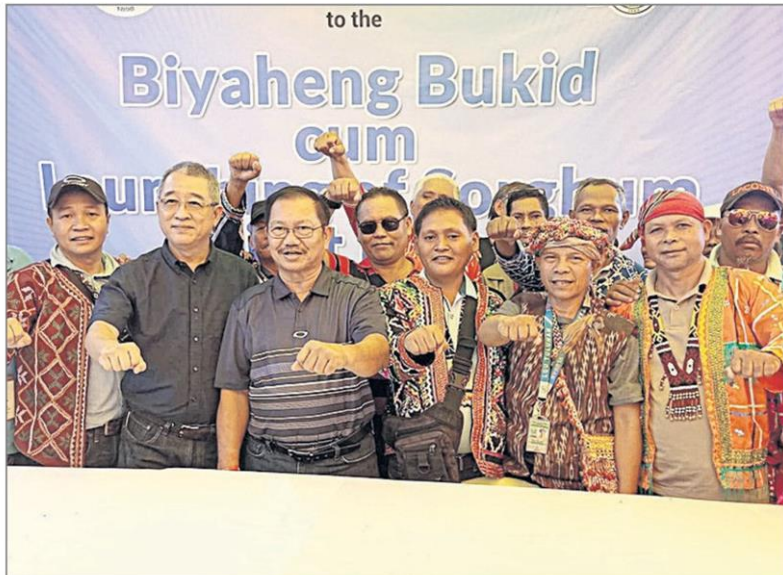
ลงนาม : กรมวิชาการเกษตร กระทรวงเกษตรสหกรณ์ฟิลิปปินส์ ร่วมกับบริษัท เจริญโภคภัณฑ์อาหาร คอร์ปอเรชั่น ฟิลิปปินส์ (ซีพีเอฟ ฟิลิปปินส์) บันทึกความเข้าใจ (MOU) โครงการพัฒนาข้าวฟ่างแห่งชาติ เพื่อสนับสนุนการเพาะปลูกและรับซื้อข้าวฟ่างแก่เกษตรกรชาวฟิลิปปินส์