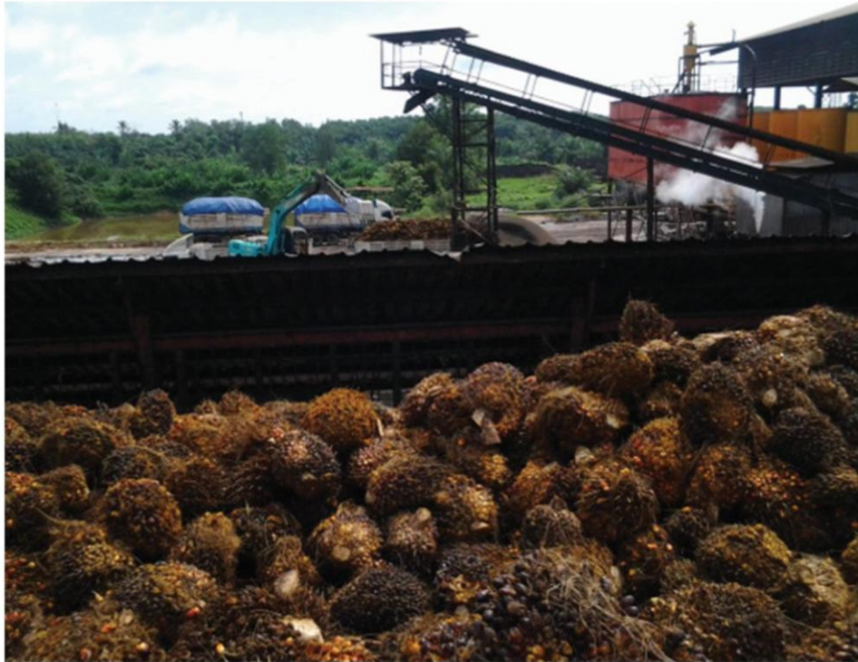
Palm nuts being loaded at a processing plant in Surat Thani. PICHET CHURAK